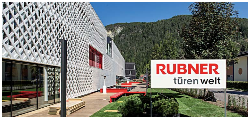
La sede della Rubner Porte a Chienes