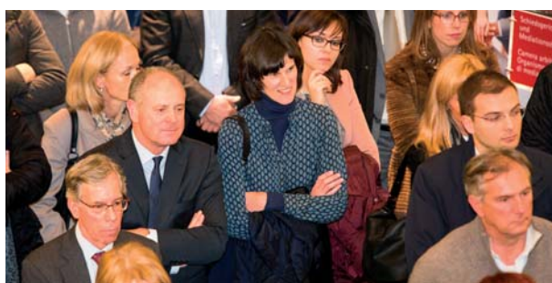
Molti rappresentanti dell'economia altoatesina hanno partecipato all'Incontro di inizio anno a Bolzano