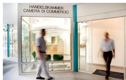
La sede distaccata di Merano

Registro delle imprese tel. 0471 945 661 - 627 registroimprese@camcom.bz.it