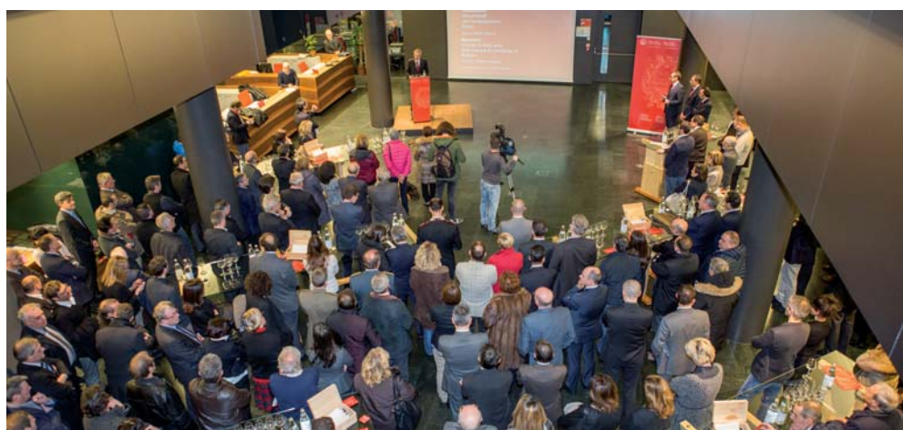
Pubblico dell'Incontro di inizio anno a Bolzano