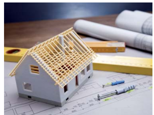
Nuove competenze: listini prezzi delle opere edili e non edili

imprese verso la pubblica amministrazione. Le imprese certificate possono cedere il credito o richiederne l'anticipazione a banche e intermediari finanziari oppure compensare il credito certificato con somme dovute per tributi erariali e locali. A ciò si aggiunge anche la fatturazione elettronica: da aprile 2015 le imprese che forniscono beni e servizi alle pubbliche amministrazioni potranno inviare le relative fatture esclusivamente in formato elettronico attraverso un'apposita piattaforma. La Camera di commercio di Bolzano mette a disposizione uno strumento gratuito per compilare, trasmettere e conservare a norma le fatture elettroniche.