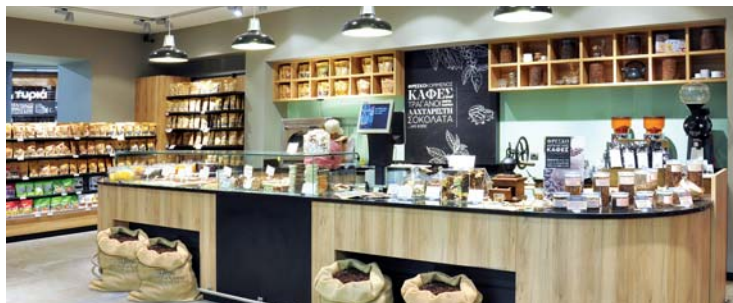
Lo showroom della catena greca Alpha Beta ideato dalla Schweitzer Group

Naturalmente metropoli come Monaco o Zurigo presentano vantaggi notevoli. Basti pensare ai grandi aeroporti situati nelle loro vicinanze. Noi, però, abbiamo scelto un'altra strada, cioè di impiantare piccole filiali laddove si trovano i nostri clienti più importanti. 15, 16 in tutto il mondo, l'ultima delle quali a San Francisco. Piccole unità indipendenti che possono contare sul sostegno di