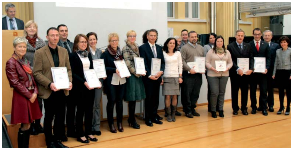
Nove imprese ed enti che conciliano famiglia e lavoro hanno ottenuto l'"audit famigliaelavoro"

Recentemente è stato conferito l'"audit famigliaelavoro" a nove imprese ed enti altoatesini. Ulteriori sei aziende hanno confermato l'audit già conseguito.