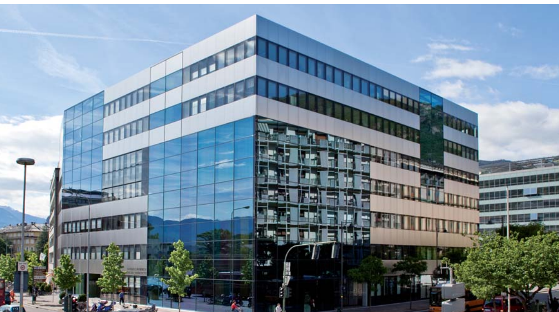
La sede della Camera di commercio in via Alto Adige a Bolzano

Un tema centrale dell'attività di quest'anno della Camera di commercio è il finanziamento d'impresa, che riveste un ruolo fondamentale per ogni attività imprenditoriale. Con l'iniziativa Finanziamento d'impresa saranno organizzate delle manifestazioni informative gratuite e seminari. La nuova guida sul finanziamento d'impresa informa sulle modalità alternative e complementari dell'approvvigionamento di capitale. Inoltre, con il test di autovalutazione "FitForRating" è possibile posizionare un'impresa rispetto alla media del proprio settore in Alto Adige sia dal punto di vista qualitativo che da quello quantitativo. Per valutare meglio i rischi ed essere più competitivi anche a livello internazionale gli imprenditori e le imprenditrici hanno a disposizione consulenze