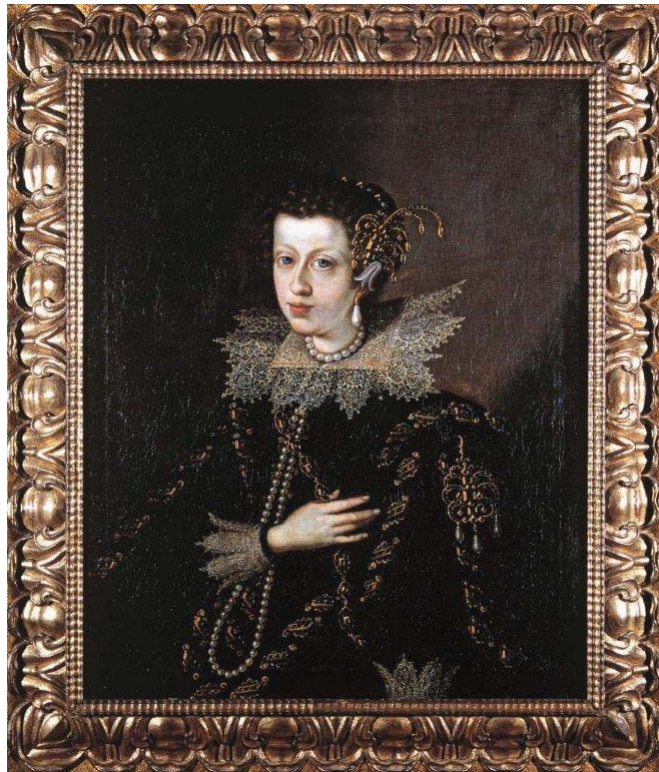
Unbekannter Künstler, Claudia de' Medici , 1645/1648

Schülerinnen und Schüler der Mittel- und Oberschulen