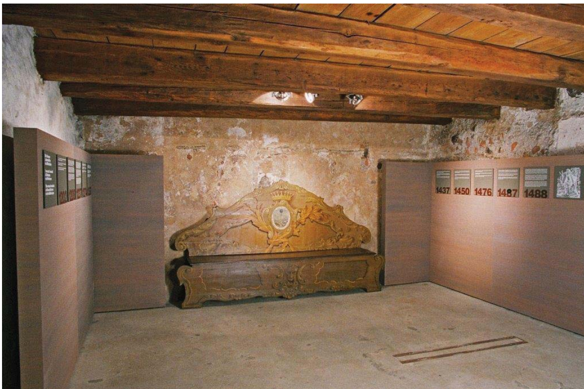
Der im östlichen Keller des Merkantilgebäudes eingestellte Raum

Schülerinnen und Schüler der Mittel- und Oberschulen